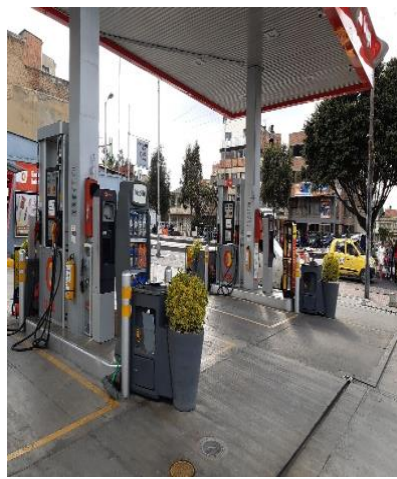
Panoramica de la Instalacion