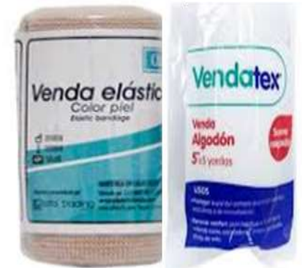
Venda Elástica Venda de Algodón