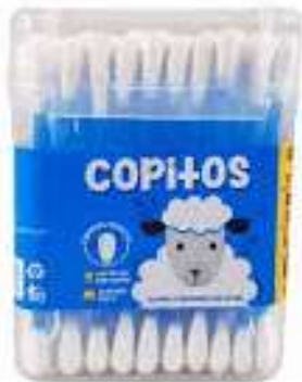
Sobre de copitos