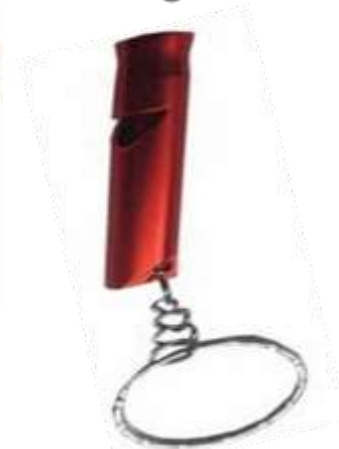
Pito de emergencia