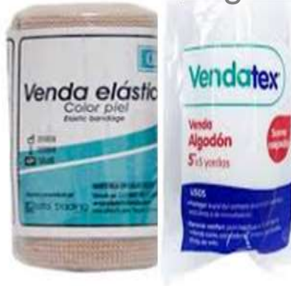
Venda Elástica Venda de Algodón