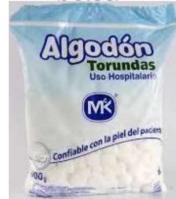
Algodón en bolsa